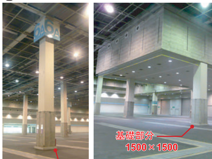
⑤ 柱-A Pillar-A 柱-B Pillar-B