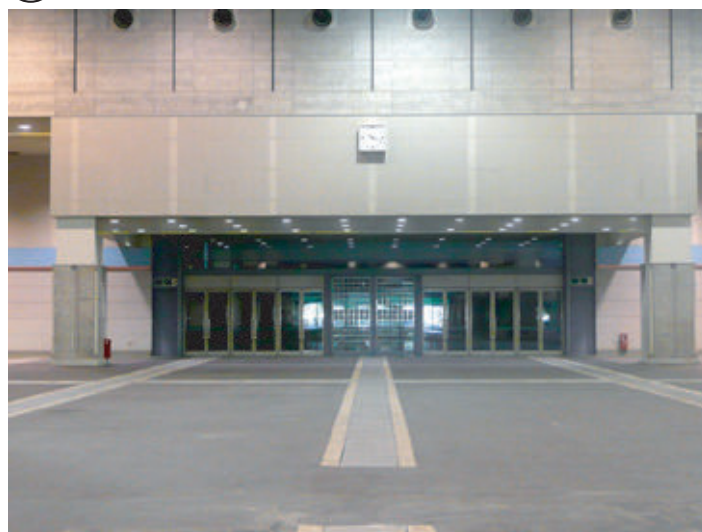
① 出入口 Entrance